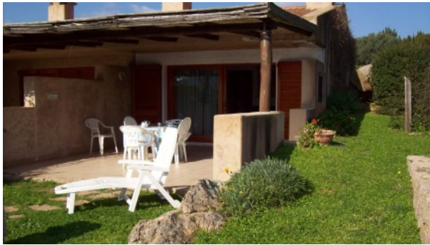
Villino a schiera